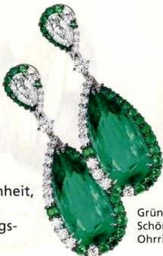
Grün ist die Hoffnung – und die Schönheit: mit den Smaragd-Ohringen von Wempe

Smaragd: Ausgeglichenheit, Disziplin und Durchsetzungsvermögen