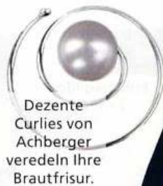
Dezente Curlies von Achberger veredeln Ihre Brautfrisur.

Simple Chic: Glaskerzenständer mit Satinband dekoriert, von Cloud 9 Design