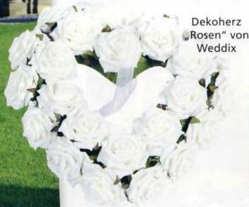
Dekoherz „Rosen“ von Weddix

Für einen strahlend frischen Teint: Rouge von Bobbi Brown