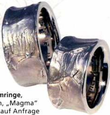
Träumringe, Platin, „Magma“ Preis auf Anfrage