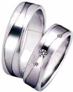
Gerstner, 950 Pt, Sie um 2.304 Euro, Er um 2.057 Euro