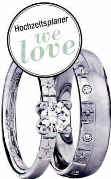
Johann Kaiser, 950 Pt, Paar um 4.903 Euro, Beisteckring um 5.005 Euro Ringpaar mit Handziselierung in 950/- Platin; Damenring mit 8 Brillanten mit Solitaire-Beisteckring aus 950/- Platin mit Brillant 0,50 ct. Der Solitärering ist ebenfalls ein schöner Verlobungsring und mit verschiedenen Steingrößen erhältlich!