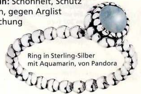
Ring in Sterling-Silber mit Aquamarin, von Pandora

Aquamarin: Schönheit, Schutz auf Reisen, gegen Arglist und Täuschung