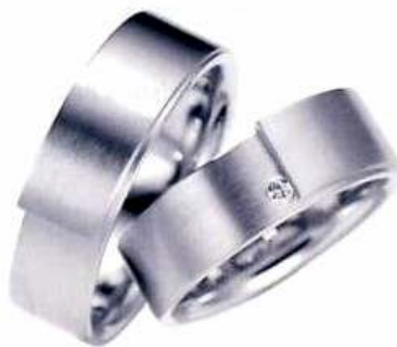
Henrich & Denzel, 950 Pt, Sie um 2.060 Euro, Er um 1.990 Euro