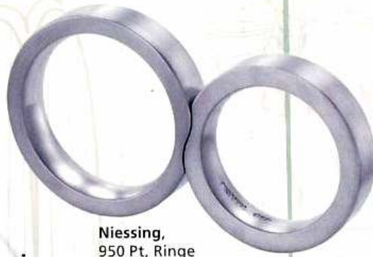
Niessing, 950 Pt, Ringe ab 1.825 Euro