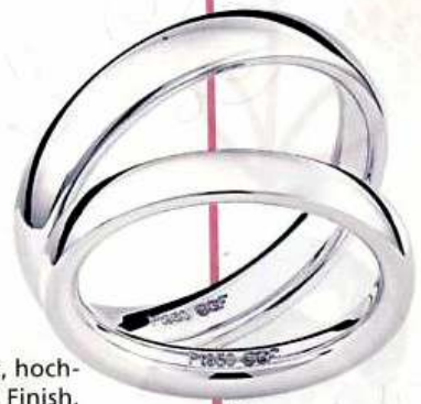
EGF, 950 Pt, hochglänzendes Finish, Preis auf Anfrage