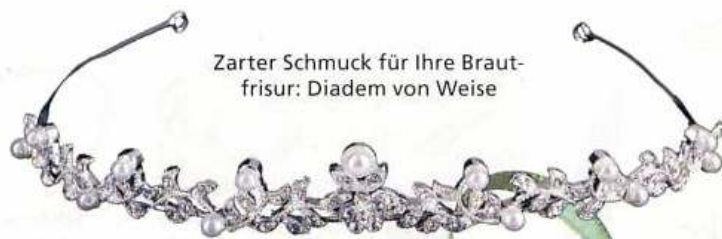
Zarter Schmuck für Ihre Brautfrisur: Diadem von Weise

Eine schmeichelhafte Silhouette und zauberhafte Details verbindet das Brautkleid „Alicia“ aus der Kollektion Schlossallee von Das Braut Atelier.