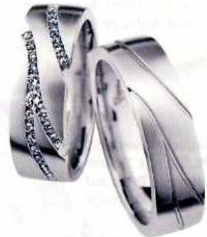
Christian Bauer, 950 Pt, Damenring besetzt mit Brillanten, Preis auf Anfrage