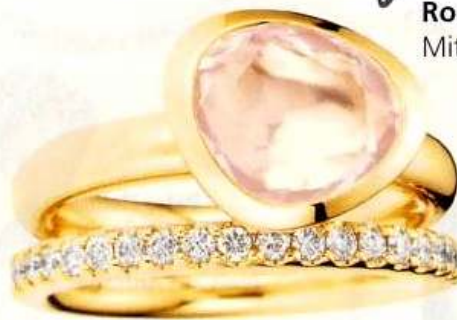
Ring mit Rosenquarz von By Kim

Rosenquarz: Glück in der Liebe, Mitgefühl und Kreativität