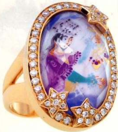
Ein Amethyst bedeckt das handbemalte Porzellanplättchen mit einem von „1001 Nacht“ inspirierten Motiv. Ring von Meissen Joaillerie

Amethyst: Liebe und Treue, Aufrichtigkeit und Entschlossenheit