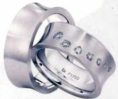
Wörner, 950 Pt, für Sie mit sieben Brillanten, Preis auf Anfrage