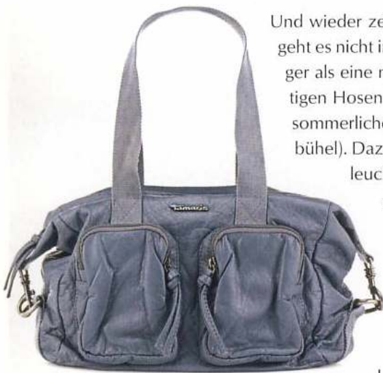
Ein cooler Begleiter zur lässigen Jeansmode ist der Bowling Bagin Denim aus strapazierfähigem PU (Tamaris). Die Tasche gibt es noch in Schwarz und Grau.

Und wieder zeigt er sich von einer neuen Seite. Denn hier geht es nicht immer nur um die Jeans, sondern um nichts weniger als eine modische Stilrichtung. Und dazu gehören neben den kultigen Hosen auch die passenden Accessoires. Wie beispielsweise dieses supercoole und sehr sommerliche Shirt, mit dem Frau Flagge und Selbstbewusstsein zeigt (oben, Sportalm Kitzbühel). Dazu passen super die neuen Ledercolliers, die es in tollen Farben gibt. Aqua-Töne, ein leuchtendes Gelb oder ein frisches Grün: Die Edelsteinanhänger werden in unterschiedlichen Farben und Größen an samtweichen Ledercolliers aufgefädelt. Witzig: Die Banderolen, die sich um die Kugelmittle schmiegen, appellieren an den Betrachter zum Beispiel mit »Carpe Diem!« oder »Für immer dein!« Die Anhänger gibt es übrigens auch mit Banderolen, die rundum mit Brillanten besetzt sind und verführerisch funkeln (GlanzundGloria by Beatrice Müller). Verführerisch – auf jeden Fall für alle weiblichen Fans von Sommerstiefeln – sind diese Stiefeletten in Türkis (Tamaris, gesehen bei Indigo), die nicht nur zur Jeans top aussehen.