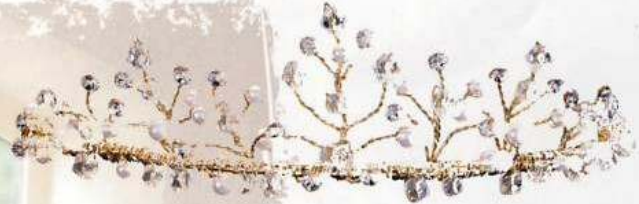
Touch of Glamour Tiara