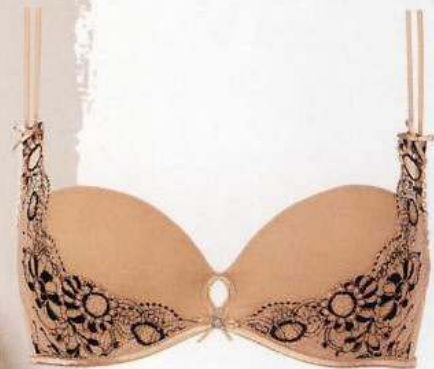
Valisere «TRAIN NOSTALGIQUE»- KOLLEKTION Dessous