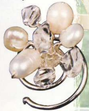
Touch of Glamour Curly