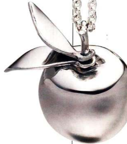
Nicht reinbeißen Apfelkette von Glanz und Gloria