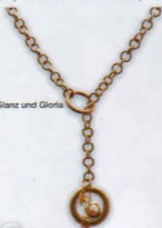
Kette von Glanz und Gloria