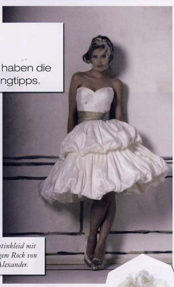
Seidensatinkleid mit bauschigem Rock von Justin Alexander.

Kurze Röcke setzen sich mehr und mehr auch in der Brautmode durch und sorgen für einen mädchenhaft verspielten Look.