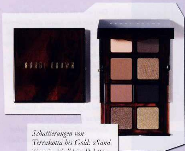
Schattierungen von Terrakotta bis Gold: «Sand Tortoise Shell Eye Palette» von Bobbi Brown.