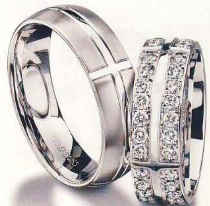
Dieses Ringset aus Weißgold ist von Furrer-Jacot. Der Männerring besteht aus einer matten und polierten Oberfläche sowie breiten Fugen. Die Braut darf sich über zwei Reihen mit insgesamt 56 Brillanten freuen.