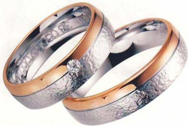
Dieses Ringpaar von Fischer besteht aus Rot- und Weißgold. Die Struktur nennt sich „gehämmerte Oberfläche“.