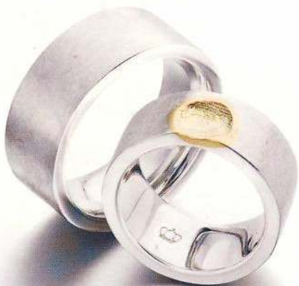
Impression heißt dieses Platin-Ring-Paar von Glanz und Gloria. Als extra Schmankerl können Sie den Fingerabdruck Ihres Schatzes gravieren lassen.