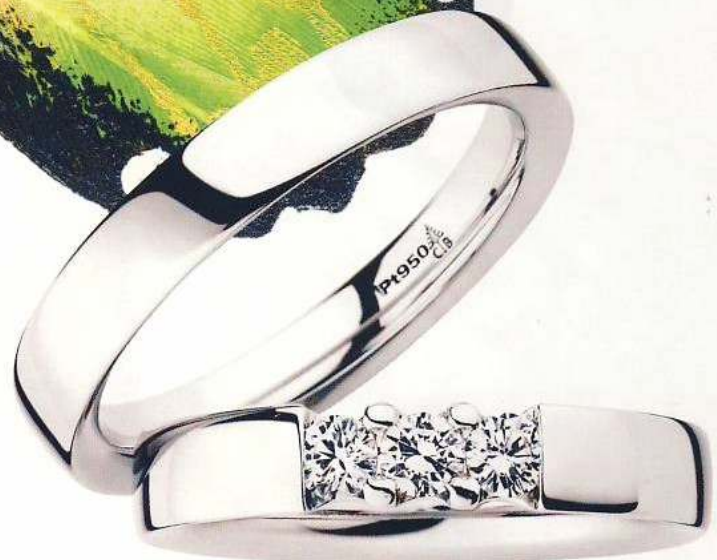
Zwei funkelnde Diamanten schmücken diesen Ring aus Platin. Von Christian Bauer.